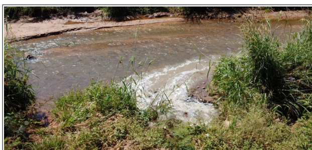
Descrição: Detalhe da alteração das características de cor no local de Esgoto Sanitário no córrego do Sapo.