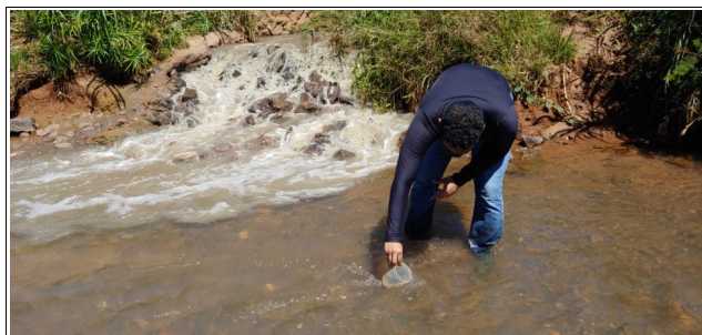
Descrição: Ponto de coleta a MONTANTE da contribuição do extravasor da EEE Sapo no córrego do Sapo.