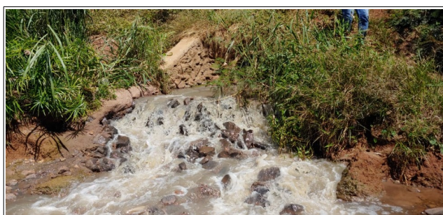
Descrição: Ponto de contribuição de Esgoto Sanitário no córrego do Sapo.