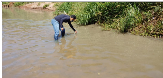
Descrição: Ponto de coleta a JUSANTE da contribuição do extravasor da EEE Sapo no córrego do Sapo.