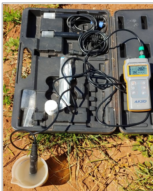
Autor: AMAE/RIO VERDE Descrição: Medição de Oxigênio Dissolvido (OD) da amostra coletada a JUSANTE da contribuição de Esgoto Sanitário.