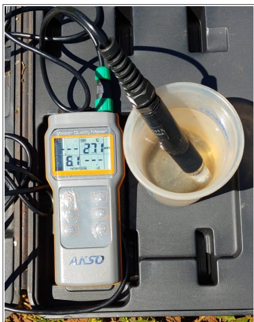
Autor: AMAE/RIO VERDE Descrição: Medição de Oxigênio Dissolvido (OD) da amostra coletada a MONTANTE da contribuição de Esgoto Sanitário.