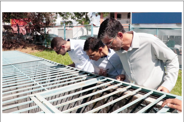
Autor: AMAE/RIO VERDE Descrição: Inspeção das caixas de operação e bombas.