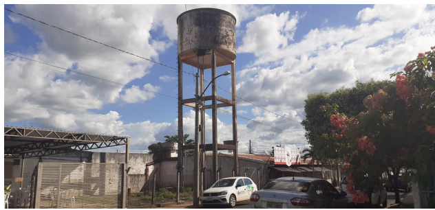
Descrição: REC Vila Carolina