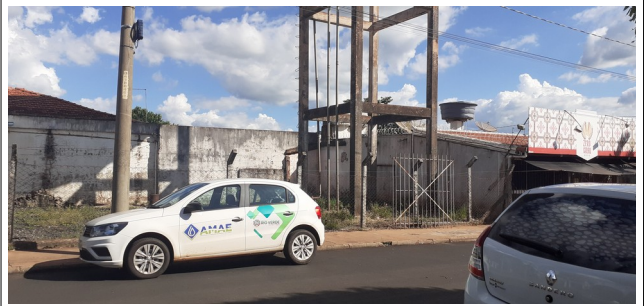
Autor: AMAE/RIO VERDE Descrição: Área de instalação do REC