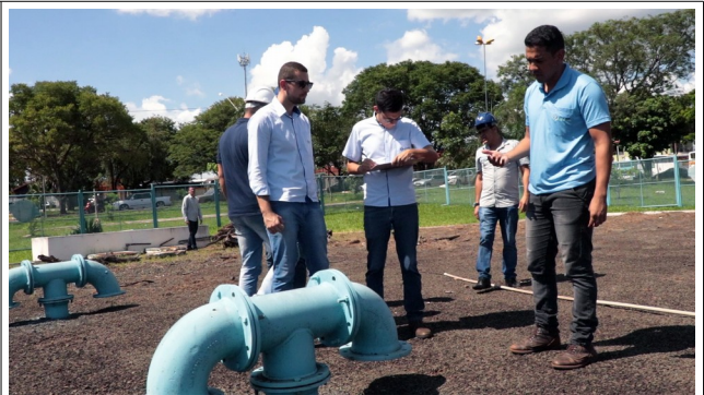
Descrição: Equipe AMAE em vistoria do RSEC Praça