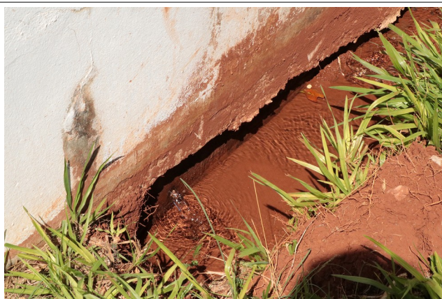
Descrição: Vazamento na parede lateral RSEC Praça