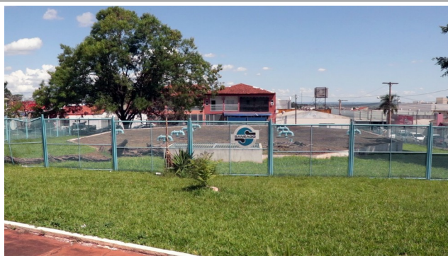
Autor: AMAE/RIO VERDE Descrição: RSEC Praça Central