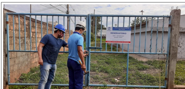
Descrição: Entrada do reservatório