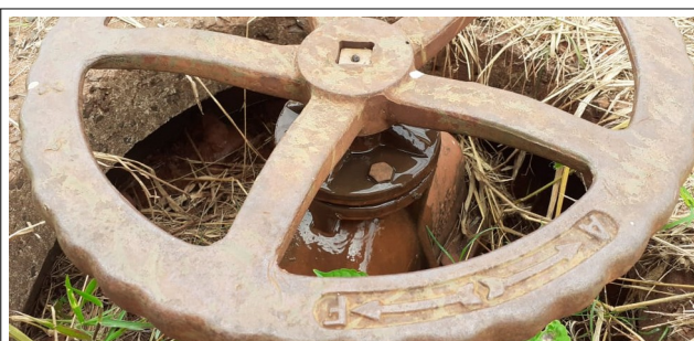
Autor: AMAE/RIO VERDE Descrição: Gaxeta com vazamento