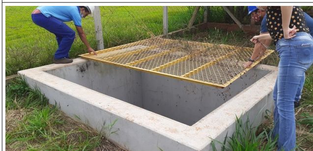
Descrição: Grade retirada