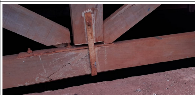
Descrição: Estrutura de madeira do telhado