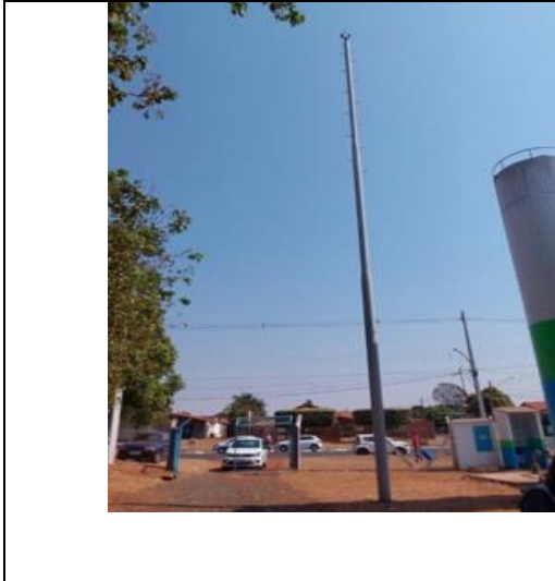
Foto: Reservatório Vila Bela 01 - Para-raios.