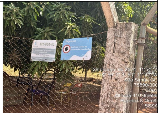
Autor: AMAE Foto: Sistema Colombo – Estação Elevatória de Esgoto Beira Lago 01.