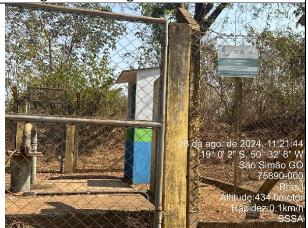
Autor: AMAE Foto: Sistema Colombo – Poço Colombo 04.