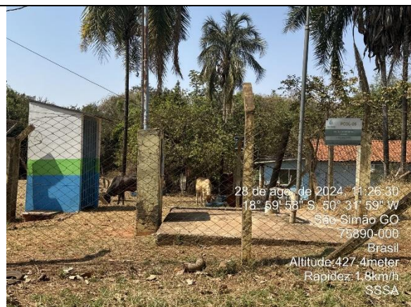
Autor: AMAE Foto: Sistema Colombo – Poço Colombo 06.