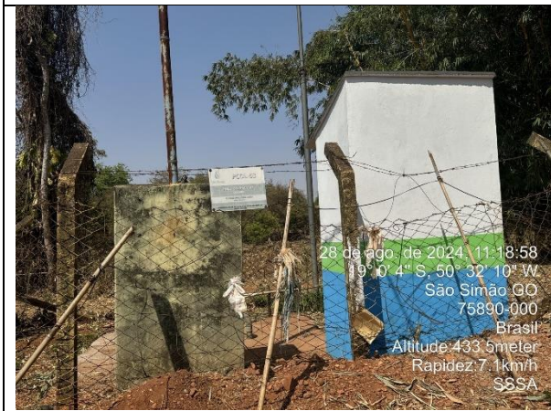
Autor: AMAE Foto: Sistema Colombo – Poço Colombo 03.