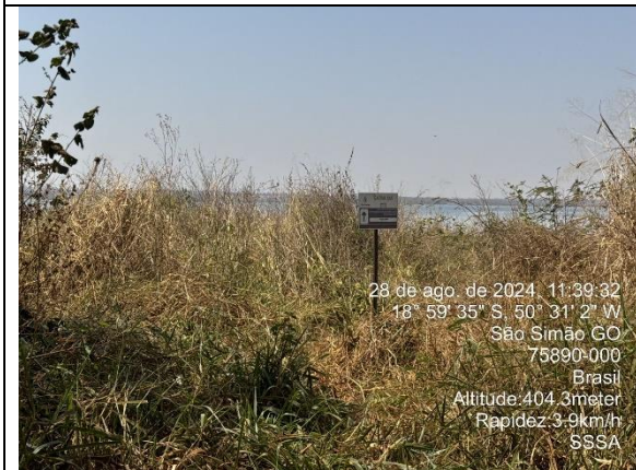
Autor: AMAE Foto: Sistema Colombo – Saída da ETE.