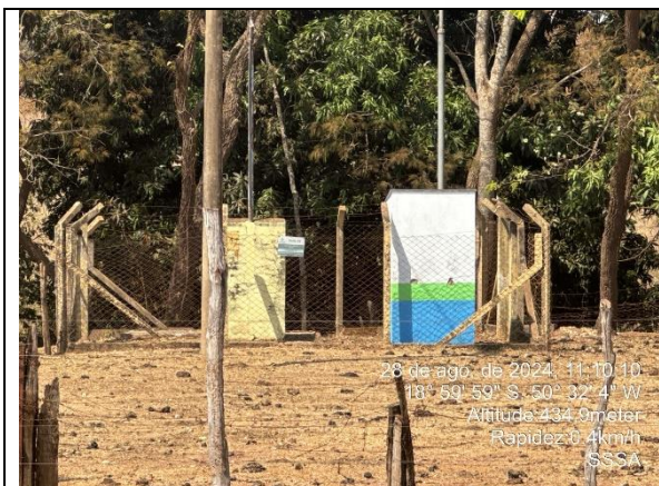
Autor: AMAE Foto: Sistema Colombo – Poço Colombo 05.