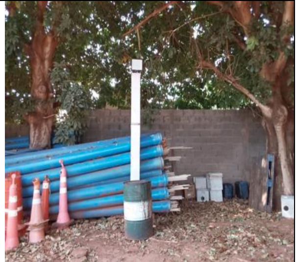
Autor: AMAE Foto: Reservatório Vila Bela 01 - Iluminação.