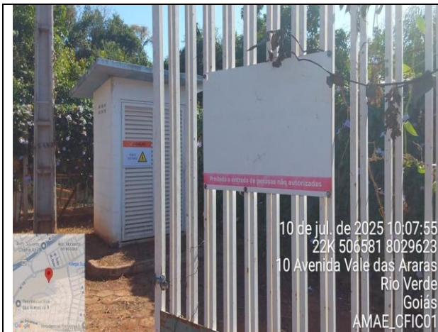
Figura 5 – Poço PVA 03 Araras Não Conformidade: Placa ilegível