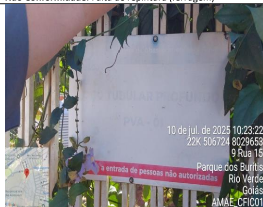
Figura 8 – Poço PVA 01 Araras Não Conformidade: Placa ilegível