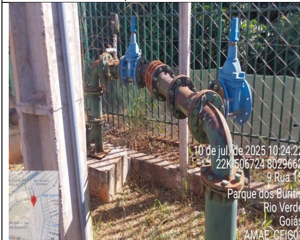
Figura 9 – Poço PVA 01 Araras Não Conformidade: Cavalete sem pintura (ferrugem)