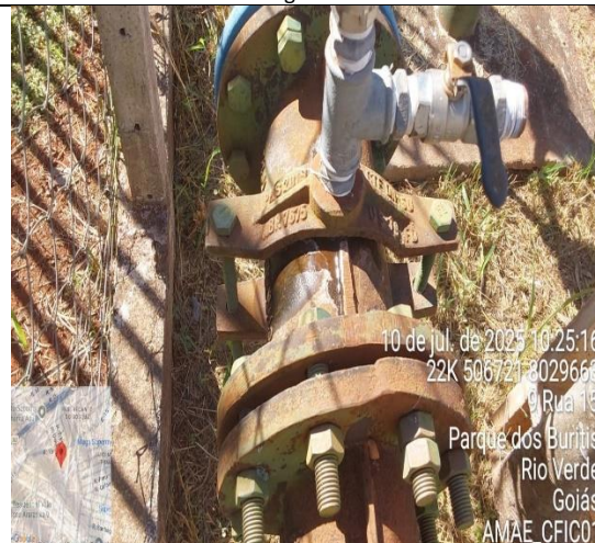
Figura 10 – Poço PVA 01 Araras Não Conformidade: Cavalete com vazamento de água.