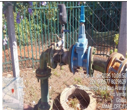
Figura 6 – Poço PVA 03 Araras Não Conformidade: Falta de repintura (ferrugem)