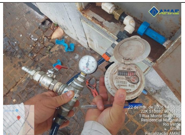
AMAE. Aferição de pressão no cavalete. Rua Monte Sião, qd. 29 lt. 1, Bairro Maranata. Rio Verde GO.