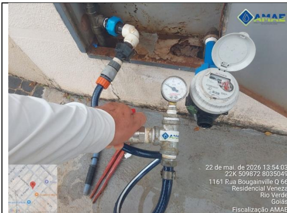
AMAE. Aferição de pressão no cavalete. Rua Guatambú, qd. 66, lt. 161 B, Bairro Veneza. Rio Verde GO.