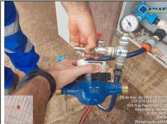
AMAE. Aferição de pressão no cavalete. Rua da Castanheira, qd. 55, lt. 935 B, Bairro Veneza. Rio Verde GO.