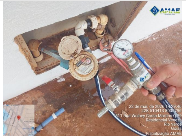
AMAE. Aferição de pressão no cavalete. Rua Wolney Costa Martins, qd. 79, lt. 1512, Bairro Veneza. Rio Verde GO.