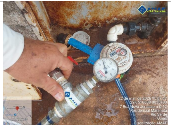
AMAE. Aferição de pressão no cavalete. Rua Nova Jerusalém, qd. 12, lt. 8, Bairro Maranata. Rio Verde GO.