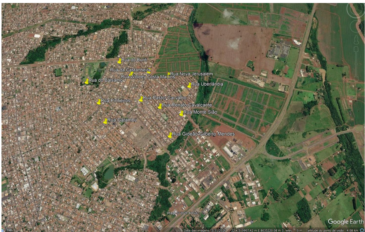
Figura 1: Identificação dos pontos onde foram realizadas as aferições de pressão nos cavaletes de entrada de água tratada.

A Figura 1 traz a identificação dos locais onde foram feitas as medições de pressão.