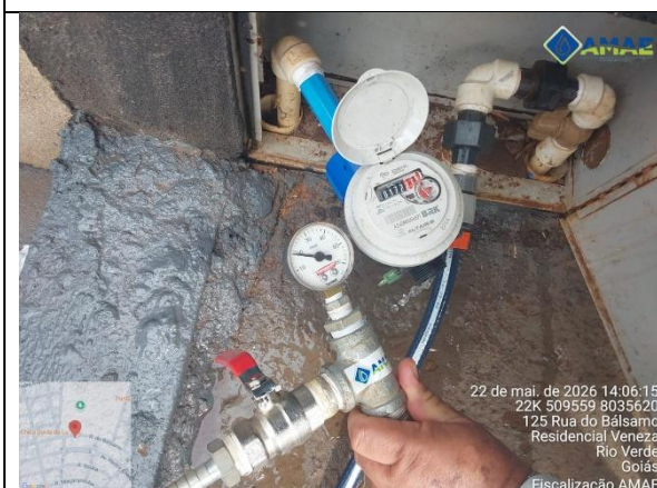
AMAE. Aferição de pressão no cavalete. Rua do Bálamo, qd. 13, lt. 124, Bairro Veneza. Rio Verde GO.