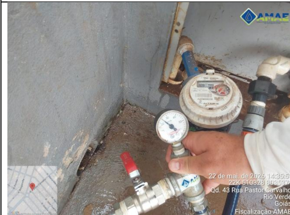
AMAE. Aferição de pressão no cavalete. Rua Pastor Carvalho, qd. 43, lt. 8, Bairro Maranata. Rio Verde GO.