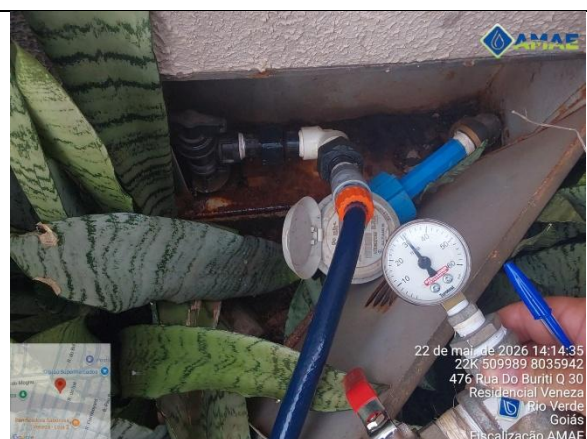
AMAE. Aferição de pressão no cavalete. Rua do Buriti, qd. 30, lt. 476, Bairro Veneza. Rio Verde GO.