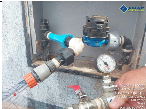
AMAE. Aferição de pressão no cavalete. Rua Pinheiros, qd. 33, lt. 536, Bairro Veneza. Rio Verde GO.