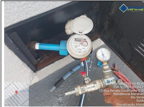
AMAE. Aferição de pressão no cavalete. Rua Renato Cavalcante, qd. 36, It. 45 B, Bairro Maranata. Rio Verde GO.