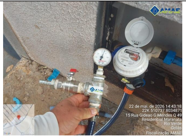
AMAE. Aferição de pressão no cavalete. Rua Gideão Gilberto Mendes, qd. 49, It. 15, Bairro Maranata. Rio Verde GO.